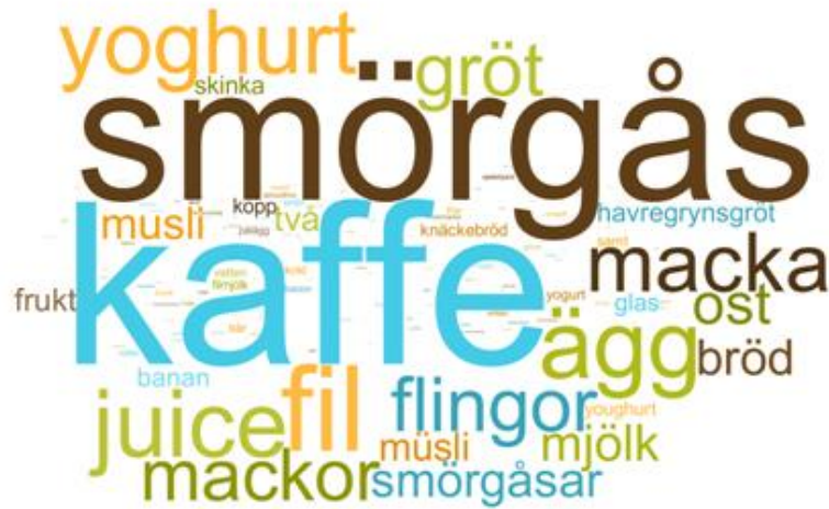
Den typiska frukosten: Sverige